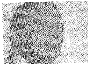
Michel Daerden.

Coprésident des Verts, ce fervent supporter des Rouches a tout pour rentrer dans la cour des people. Il a déjà joué dans ce registre, s'écartant des vertes allées de la politique pour poser déguisé en femme dans un magazine. Gendre idéal pour les unes, bobo sympathique pour les autres, "Jean-Mi" est, en tout cas, l'une des vertèbres people des verts.